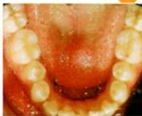
Figura 5. Ausencia del lateral inferior izquierdo.

Para tratar a los pacientes sin incisivo inferior, sin extracciones de promolares en superior, debemos de tener las siguientes características: Clase I relación molar, apiñamiento moderado de los incisivos inferiores, sin o con leve apiñamiento superior, aceptable perfil de tejidos blandos, mínima a moderada sobremordida y el resalte, mínimo potencial de crecimiento, a diferencia de tamaño del diente, como la falta de incisivos laterales o la-