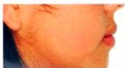
Figura 17. Perfil inicio

Comparación de las fotografías de la paciente de inicio progreso y final de perfil (figuras 17-22).