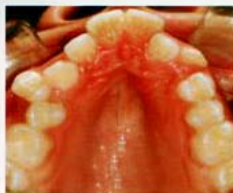
Figura 8. Oclusal superior inicial.