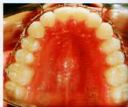
Figura 9. Progreso superior oclusal.

cinturón vestibular y retenedor circunferencial inferior. Para obtener las clase I caninas bilaterales se requería de hacer stripping , al análisis de Bolton se encontró un exceso en superior, la cantidad de discrepancia en radio de 6 era 8.2 mm (figura 8), se hizo un stripping de 7 mm, un milímetro por cada diente 3 para conseguir un overjet adecuado, eliminar el apiñamiento leve inferior de -1.1 mm según Ca-