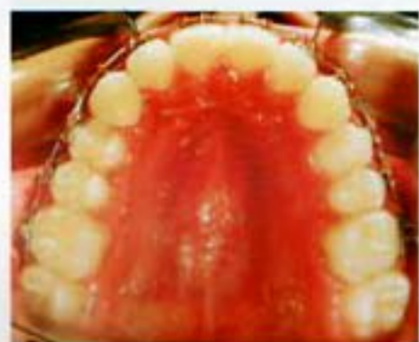
Figura 7. Expansión y stripping superior.

rey (figuras 9-12) terminar de consolidar las clases caninas se proclinaron los anteroinferiores, para solucionar el apiñamiento severo superior donde el carey negativo era de 7.8 mm, el espacio se obtuvo de por el stripping de 7 mm, el 0.8 mm y los otros milímetros necesarios para retroclinar, los supe-