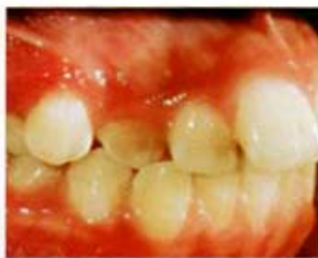
Figura 4. Canino superior derecho cruzado.