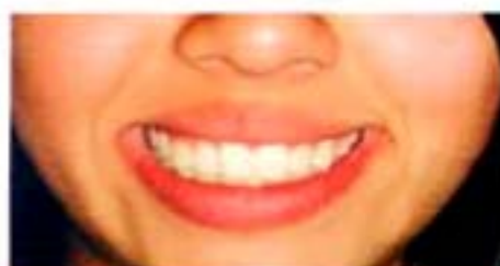
Figura 20. Frente final.