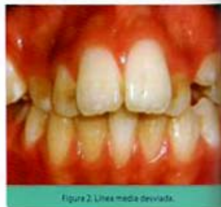
Figura 2. Línea media desviada.