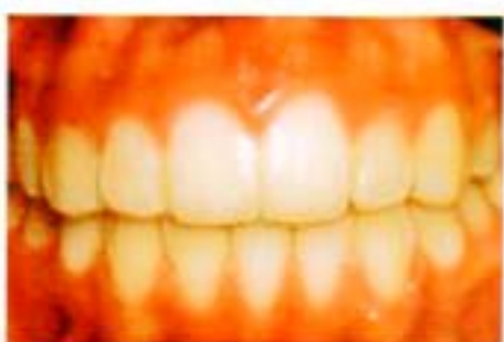
Figura 15. Frente final.