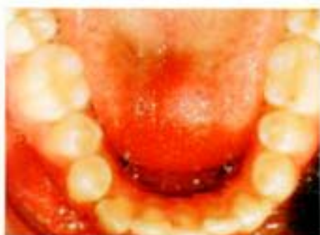
Figura 11. Oclusal inferior incisal.