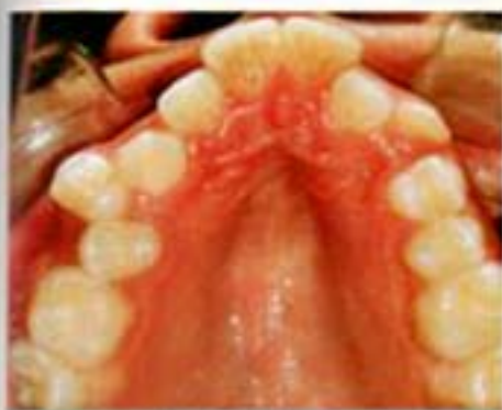
Figura 3. Arco maxilar.