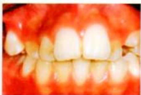
Figura 13. Frente inicial.