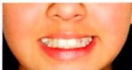
Figura 21. Frente inicio.