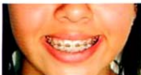
Figura 22. Frente progreso.