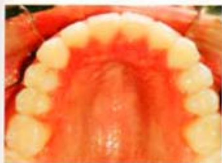
Figura 10. Oclusal superior final.