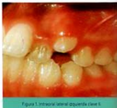
Figura 1. Intraoral lateral izquierda clase II.

Estudios iniciales: la paciente presenta una clasificación Clase II esquelética, hiperdivergente, clase II molar izquierda (figura 1), línea media superior desviada (figura 2) con 1 mm a la izquierda, antero superiores proclinalados y protruidos, apiñamiento severo superior, con arco superior triangular (figura 3), mordida cruzada del canino superior derecho (figura 4). Se consideró la anodoncia del incisivo lateral derecho inferior por la divergencia radicular y por el tamaño dental, (figura 5), además manchas cromógenas extrínsecas generalizadas posiblemente por alimento o el consumo de hierro vía oral, el cual refiere la paciente.