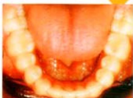
Figura 12. Oclusal inferior final.