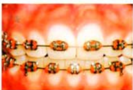
Figura 14. Frente progreso.