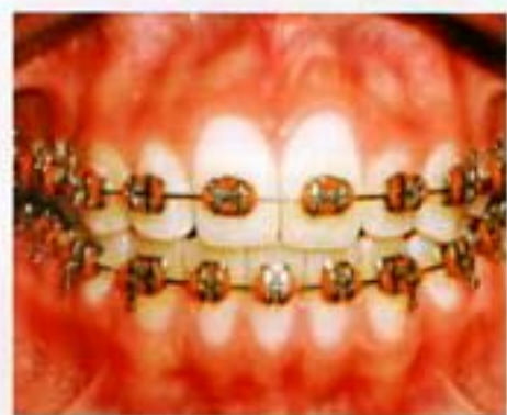
Figura 6. Brackets prescripción roth 0.022" x 0.028"

te: brackets prescripción roth 0.022" x 0.028" (figura 6), como secuencia de tratamiento una alineación, nivelación, expansión y stripping superior (figura 7), detallado y retención por medio de secuencia de arcos Nitinol 0.012, 0.014, 0.016 superior e inferior, acero 0.018, 0.020 superior e inferior, coordinación unitek B, cadenas intra-maxilares superior, elásticos clase III 2.5 oz 3/16 arco adelantado en inferior en arco acero 0.016 x 0.022, alambre de acero 0.19x0.25, elásticos en forma de (N) vector clase III, 3/8 4 onzas, retenedor circunferencial superior con