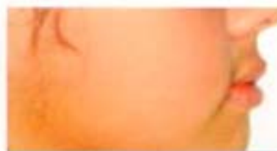
Figura 18. Perfil progreso