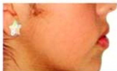
Figura 19. Perfil final